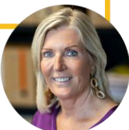
Veerle Baeyens Burgemeester van Haaltert

“Als we de middelen niet hebben om een noodzakelijke maatregel voor de veiligheid af te dwingen, sta je machteloos als burgemeester. Een sterker cameranetwerk is nodig om onze politiemensen handvaten te geven in probleemwijken om criminelen te vatten.”